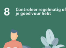
8 Controleer regelmatig of je goed vuur hebt