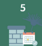
5 Laat de schoorsteen elk jaar vegen