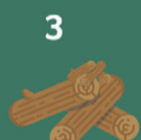
3 Leg het meest brandbare materiaal bovenop