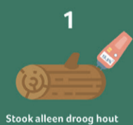
1 Stook alleen droog hout