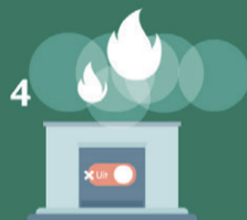
4 Sla soms een dagje over