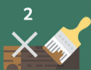
2 Stook schoon, onbewerkt hout