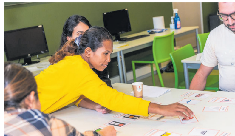
Afbeelding Bibliotheek AanZet

In Sliedrecht hebben Het Bonkelaarhuis, Rivas Zorggroep Waerthove, Stichting Werkwoord en Bibliotheek AanZet Sliedrecht de handen ineen geslagen voor het Werk-Taal-Zorg project.