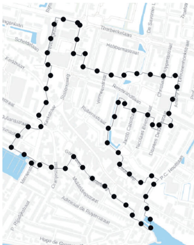
Figuur 1.0 Deelgebied omgevingsplan 1.0

In de omgevingsvisie wordt beschreven hoe de gemeente werk maakt van ruimtelijke vernieuwing door te werken aan een gezonde, sociale samenleving en een betrokken en ondernemend Sliedrecht. Hiervoor heeft de gemeente Sliedrecht ingedeeld in een aantal deelgebieden waar per deelgebied een koers wordt bepaald met de belangrijkste ontwikkelingen en prioriteiten voor de toekomst. Het centrumgebied is een van deze deelgebieden en omvat onze Kerkbuurt en een klein gedeelte van ons woongebied.