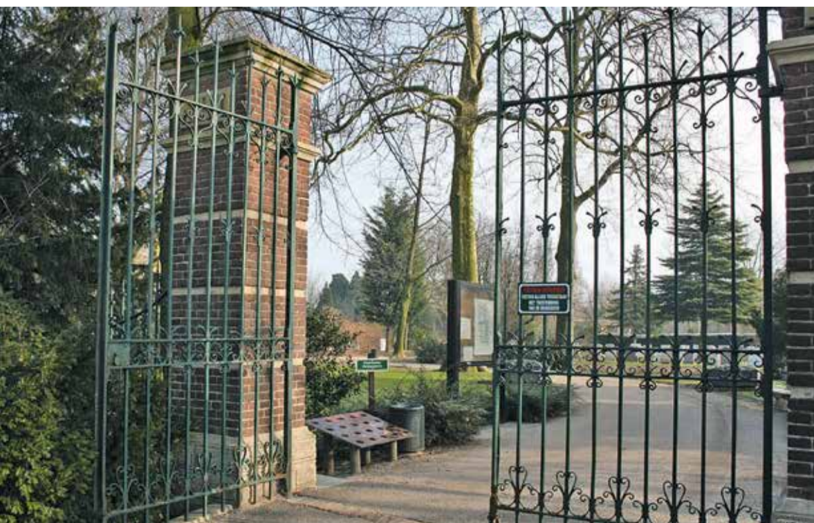
De oude poort bij de ingang van de begraafplaats

Wilt u een rondleiding volgen? U kunt zich tot woensdag 22 mei aanmelden via het e-mailadres begraafplaats@sliedrecht.nl . Geef in de e-mail aan op welke dag u wilt deelnemen. De rondleidingen starten bij de oude poort, nabij de ingang aan de Thorbeckelaan 2. Meer informatie over het landelijke initiatief vindt u op www.weekendvandebegraafplaats.nl .