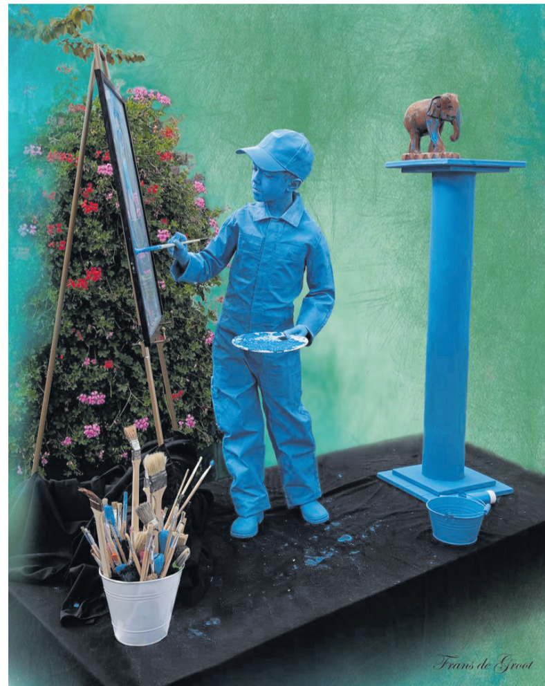
De Kunstschilder

Zaterdag 9 september, van 11:00 tot 16:00 uur, wordt het evenement 'Living Statues & Art Festival' weer georganiseerd. Deze editie vindt plaats op winkelpromenade Kerkbuurt, Jacob Catsstraat en Burgemeester Winklerplein. Met levende standbeelden, straattheater, muziek en dans wordt het weer een mooi evenement in Sliedrecht.