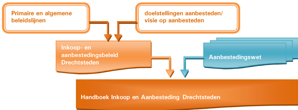
Fig. 2 Onderlinge verhouding beleid, wet en handboek

Het Inkoophandboek wordt opgesteld en actueel gehouden door team Inkoop en juridisch getoetst door het Juridisch Kenniscentrum van het Servicecentrum Drechtsteden.